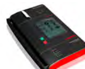
【ランチ X-431/ Diagon】