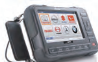
【インターサポート G-scan】