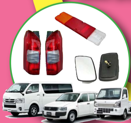
商用車テールレンズ 商用車サイドミラー