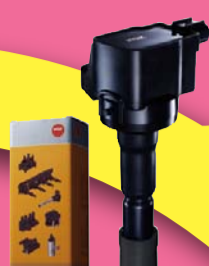
ダイレクト イグニッションコイル