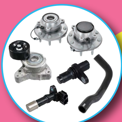
ハブベアリングAssy オートテンショナー カム角クランク角センサー ラジエーターホース