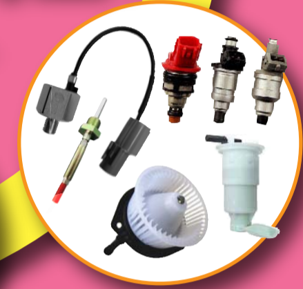
ロックセンサー 排気温センサー フューエルインジェクター フューエルポンプ ブローモーター

2016年、車検台数が減少する予測の年。自動車整備業の総売上高に占める車検整備売上は約4割にのぼります。私たち日本パーツは、これからも、お客様の整備収益のお役に立てるようなご提案をし続けます。