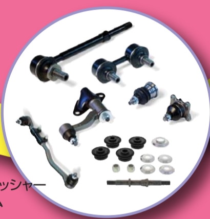
スタビリンク スタビブッシュワッシャー アイドラーアーム ボールジョイント サイドロッド